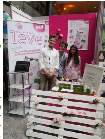
Ein moderner, eleganter Stand für ein modernes und elegantes Produkt: Der Erfrischungsdrink von Leve.