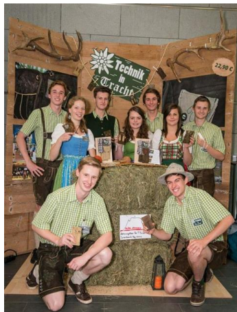
Technik in Tracht mit ihrem rustikalen Messestand. Produkt: Smartphonehüllen im Lederhosenformat

Der Stand bei der Handelsmesse dient in erster Linie als Visitenkarte des Unternehmens. Bei der Gestaltung sollte man sich immer vor Augen halten, dass weniger mehr ist. Das heißt, dass der Stand keinesfalls zu überladen sein soll, um dem Besucher einen guten Überblick über das Unternehmen und das Produkt zu ermöglichen. Kleine Besonderheiten helfen dabei, sich von den anderen Ständen abzuheben und in Erinnerung zu bleiben. Hierbei ist eure Kreativität gefragt, jedoch sollte der Stand nicht durch zu viele Aktionen überladen sein. Wichtig ist auch, dass ihr am Stand selbstbewusst auftretet, dabei zählt nicht nur, dass ihr kommunikativ seid, sondern auch eure fachliche Kompetenz, es reicht nicht nur kompetent auszusehen. Tretet selbstbewusst auf die Besucher zu, verkauft ihnen euer Produkt bestmöglich und seid auch auf mögliche Fragen vorbereitet.